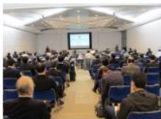
洗浄技術フォーラム

出展社数：142社・団体。 会員企業様 44社 3日間来場者累計：27,755名 新型コロナウイルスの5類感染症への移行後、最初の開催となり、大勢の方にご来場いただきました。