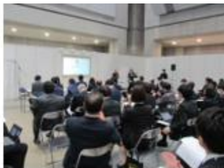
洗浄ビジネスセミナー

技術フォーラム、洗浄 ビジネスセミナーとも充 実した内容となり多数の方々 にご聴講頂きました。